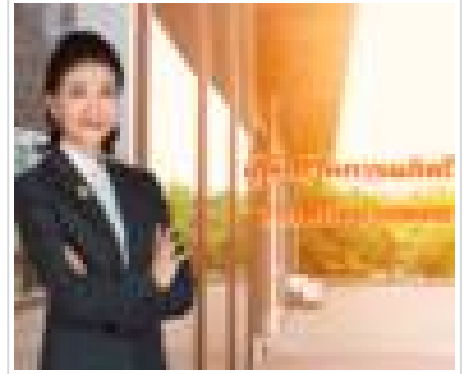
นางสาว พิธีกร