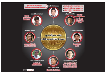
แก๊งโคงบิกคอบนี่ปิ่น'เดีเอ็นเอ'