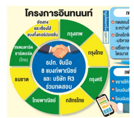
สปท.ทดสอบโอนเงินดิจิทัล