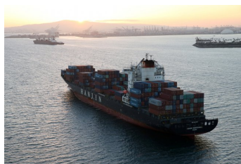
ศก.ฟื้นต้นค้ำปากแข็ง-ผู้ส่งออกยังไม่กระทบ