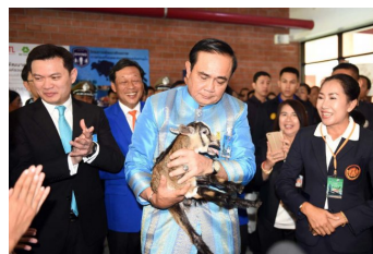
ชงคสช.รื้อไพรมารีโหวต