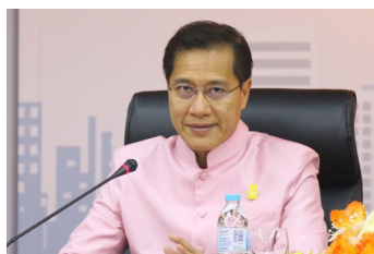
บัวแก้วไฟเขียว'ดับเบิล วิชา' ท่องเที่ยวชมรม.พื้น'จีน'