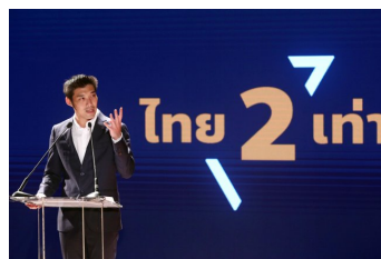
สระบุรียกทีมเข้าปลั่งประชารัฐ