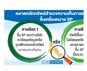
ตลาดเล็งแก้เกณฑ์เอสพี