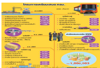
'สมคิด' วิจารณ์การลงทุนภาครัฐ