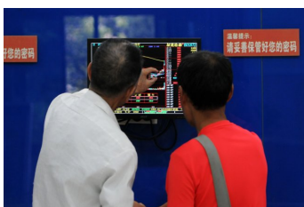
ตลาดหุ้นตึงหนักร่วงทั่วโลก หวั่นเศรษฐกิจจีนทรุด