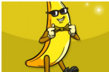
เข็นครก By : นายกล้วยหอม