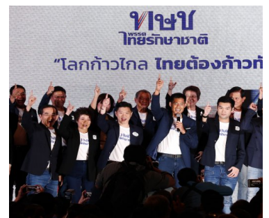
เปิดทช.เครือข่ายแท็กซี่พันธุ์