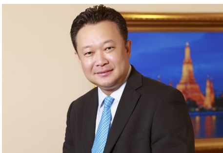
อัดแกรนด์เซลพื้นที่ท่องเที่ยว โชว์พาสพอร์ตแลกลดสินค้า