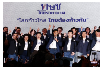
เปิดกษ.เครือข่ายกักขังฟรี