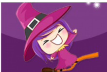
ตามงบ-ข่าว By : แมมदन้อย