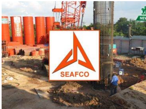
SEAFCO ใ้ทำงาน 2 โครงการใหม่ มูลค่ารวม 262.20 ลบ. โครงการก่อสร้าง Q2 นี้ ต่อเนื่อง เป้า 10.20 บ.