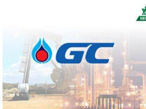
PTTGC จะซื้อหุ้นคืนไม่เกิน 3 พันลบ. 50 ล้านหุ้น ตั้งแต่ 11 มิ.ย.ถึง 9 ธ.ค.62