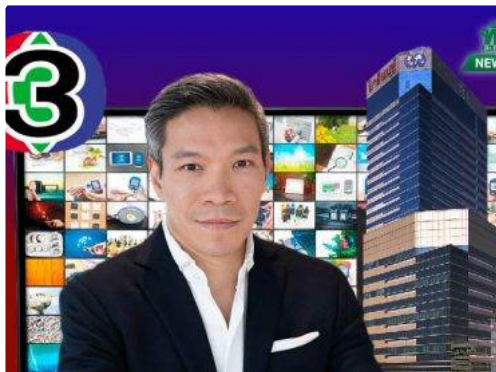
BEC สืบผลงานปีที่ดี เร่งปรับ 6 ธุรกิจใหม่เสริมแกร่ง