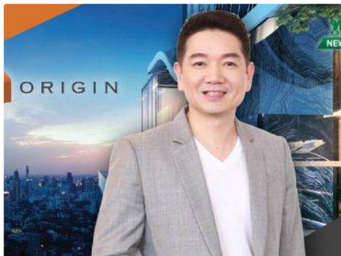
ORI ขึ้นแท่นเข้า SETHD ควน SET100 มั่นใจรายได้ปี 62แตะ 1.9 หมื่นล.ตามเป้า