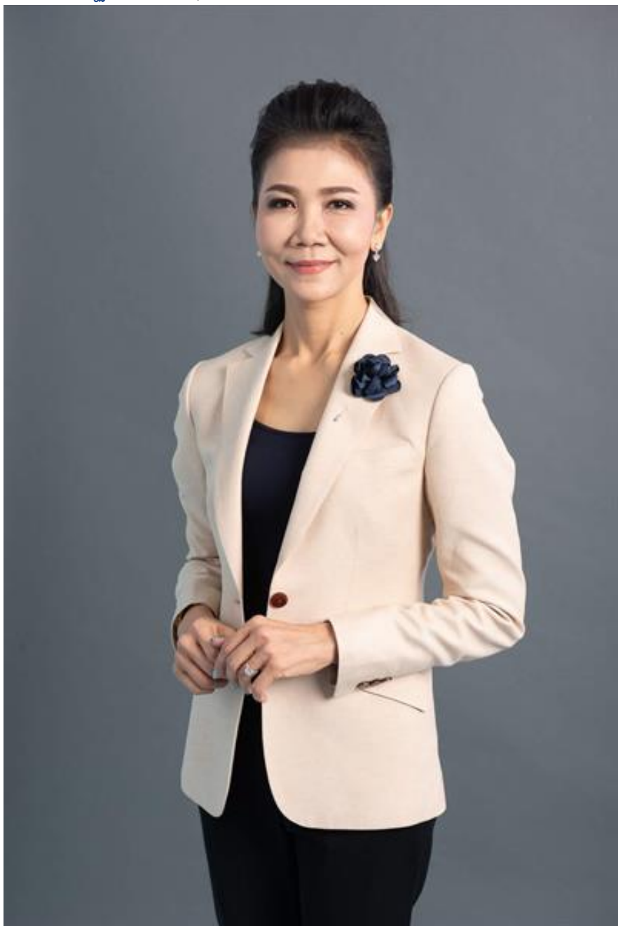
บมจ.กันกุลเอ็นจิเนียริง (GUNKUL) ส่งสัญญาณกำไรปี' 62 เติบโตโดดเด่น เนื่องจากรายได้จากการขายไฟฟ้าโครงการกังหันลมและ

ข่าวเศรษฐกิจ 29 พฤศจิกายน พ.ศ. 2562 13:40 น. –ThaiPR.net