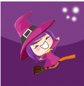
แม่มดน้อย

***การลงทุนมีความเสี่ยง ผู้ลงทุนควรศึกษาข้อมูลก่อนการตัดสินใจลงทุน***