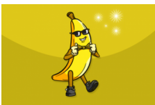
ขึ้นยาก By : นายกล้วยหอม