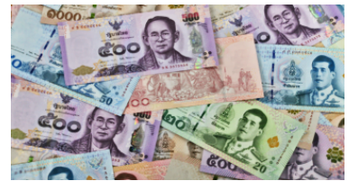
เงินบาทเปิด 31.18/20 ต่อดอลลาร์ แนวโน้มทรงตัว ตลาดไร้ปัจจัยใหม่