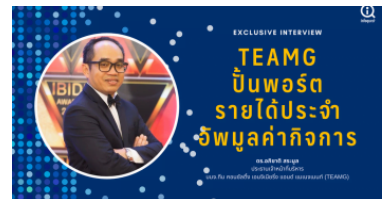
TEAMG ปันพอร์ตรายได้ประจำแตะ 25% ใน 5 ปี- เล็ง M&A อพุมูลค่าธุรกิจ