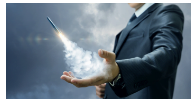
รัสเซียประกาศความสำเร็จทดสอบขีปนาวุธความเร็วเหนือเสียง