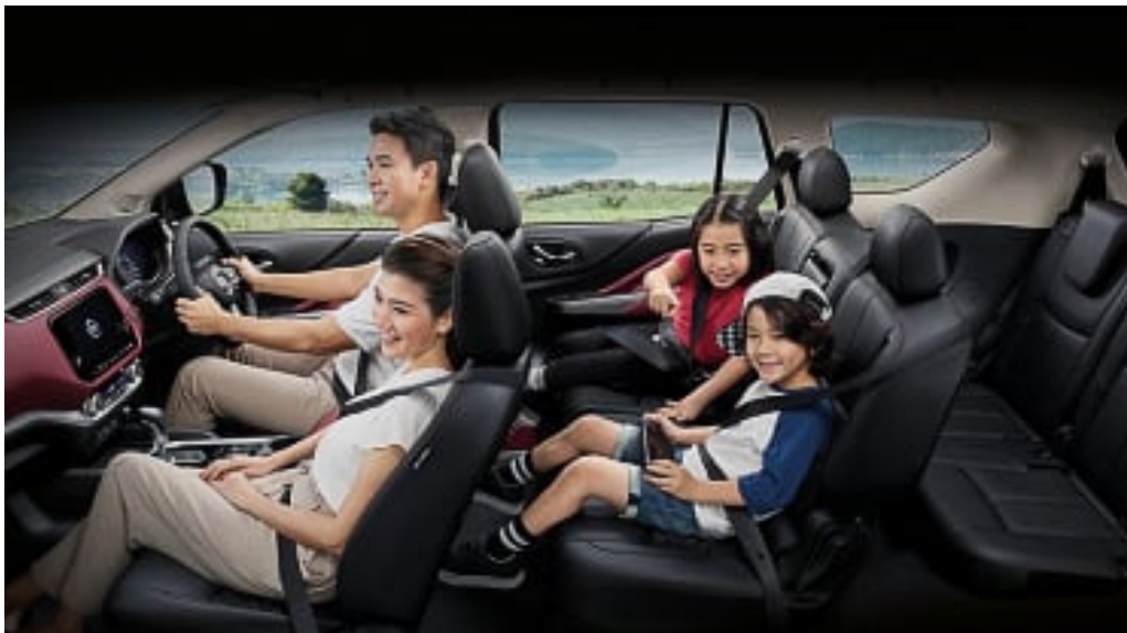
รถครอบครัว 7 ที่นั่ง กว้างสบาย พร้อมให้ความเพลิดเพลินในการเดินทาง