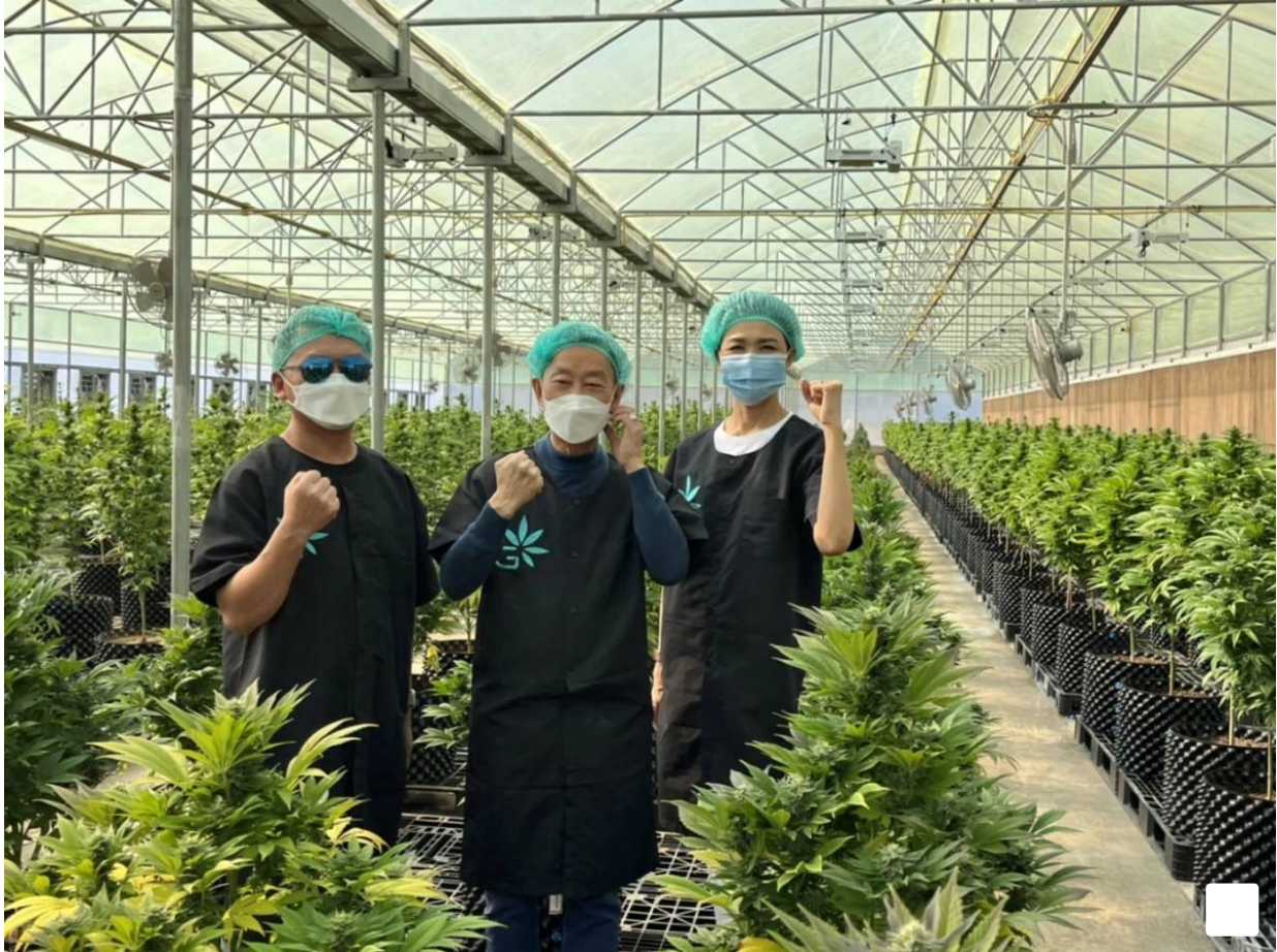
โฆษณา - อ่านบทความต่อด้านล่าง

ล็อตแรกที่ส่งขายองค์กรเภสัชกรรม เป็นไปตามสัญญาซื้อขายที่ทำได้ก่อนหน้า มั่นใจคุณภาพ ไร้สารตกค้าง เนื่องจากปลูกในระบบปิดแบบ Indoor ระดับ Medical grade